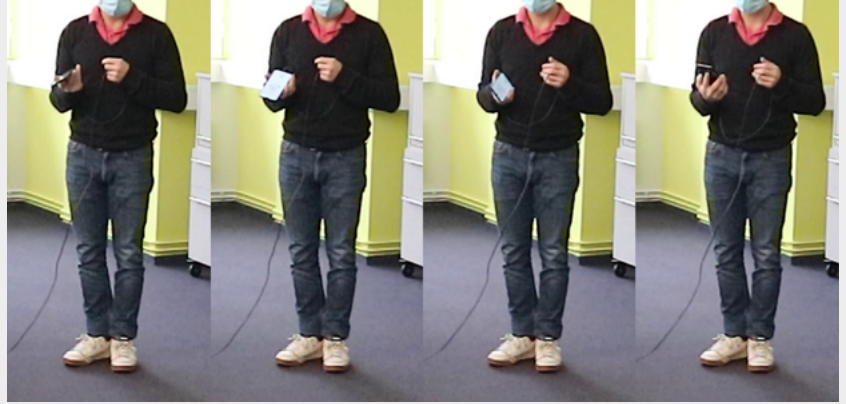
Figura 5: La participante se mueve un poco más mientras usa JoyTilt.