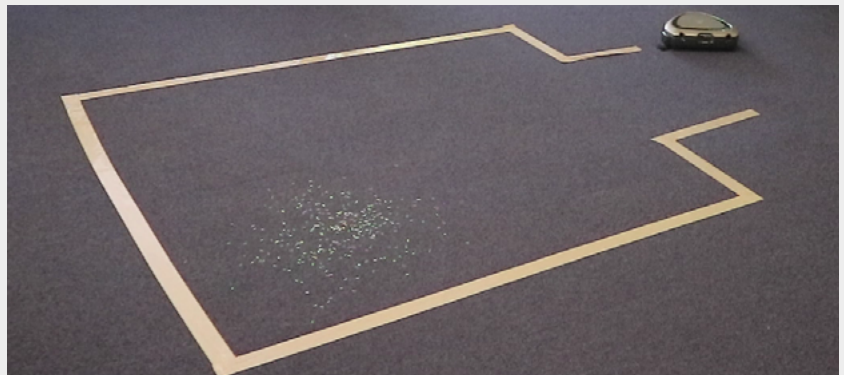
Figura 4: El suelo tal como fue escenificado para el testeo con los usuarios. Enmarcando la tarea como una navegación lúdica, la cinta representa las paredes entre las cuales debe navegar el robot, aspirando el arroz arrojado al suelo.

La sesión de prueba experimental fue realizada durante la pandemia de COVID-19, con diez voluntarios sanos que llevaban máscaras faciales. Se pidió a los compañeros de trabajo de la empresa y a los estudiantes de nuestro departamento que se ofrecieran como voluntarios porque ya estaban expuestos al contacto con la persona que conducía el experimento. El experimento constaba de tres partes. En primer lugar, los participantes aspiraron arroz esparcido en el suelo utilizando “Spot Cleaning”. En segundo lugar, utilizaron JoyTilt para conseguir el mismo resultado. En tercer lugar, clasificaron ambas experiencias en una escala de cinco puntos basada en el carácter lúdico, la facilidad, la eficacia y el disfrute, a lo que siguió un debate sobre estos aspectos de sus experiencias de usuario. En general, JoyTilt recibió una mejor puntuación en todos los aspectos, excepto en la facilidad, tal como analizaremos a continuación. La puntuación fue utilizada como punto de conversación (similar a, por ejemplo, Hardy & Rukzio, 2008), seguido de un debate sobre los casos de uso de las dos funcionalidades. También se pidió a los participantes que reimaginaran JoyTilt y mostraran cómo diseñarían el control del robot, imitando el experimento práctico realizado antes del desarrollo.