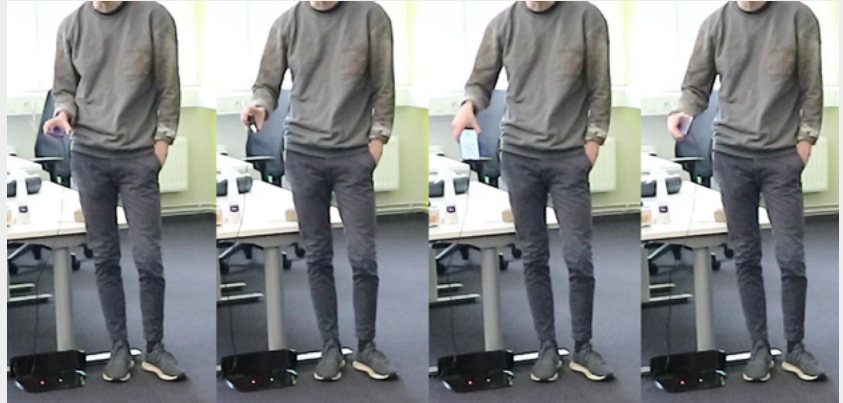
Figura 3: Uno de los participantes utiliza JoyTilt durante el experimento con una postura relajada, su mirada en el robot aspirador y moviendo solo la mano para controlarlo.

Tres de los participantes tenían una postura más tensa y parecían menos cómodos al controlar el robot (Figura 4). Este grupo también permanecía quieto y realizaba pequeños movimientos con las manos para controlar el robot mientras el resto del cuerpo permanecía quieto y la mirada se enfocaba en el robot. La postura tensa hacía pensar que los participantes se esforzaban mucho por controlar el robot, casi como si estuvieran preparados para realizar un movimiento corporal de alta intensidad. A continuación, incluimos una cita de uno de estos participantes hablando de su experiencia: