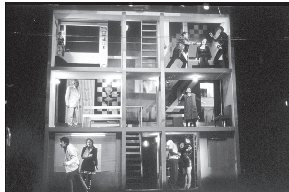
Programa de Investigación y Archivos de la Escena Teatral UC.

El teatro opera en una superposición de planos significantes diversos, “en un espesor de signos y sensaciones que se edifica a partir del argumento escrito” (Barthes 49). Esta teatralidad se construye como una pirámide de oposiciones y confluencias en tres niveles: espacio cotidiano versus espacio representacional; realidad versus ficción; instintivo versus simbólico (Féral), por lo cual lo que vemos en escena siempre “es” y “no es” al mismo tiempo. La “espesura de signos” que el teatro así genera tiene una materialidad mucho más próxima a la experiencia que tenemos del mundo en que vivimos inmersos, que la que nos entrega un texto escrito. Sin embargo, esta es una complejidad que hay que aprender a “leer”. La obra de teatro es una construcción de sentido con una lógica interna propia, donde todo es signo, ícono o símbolo necesario y significativo, en un conjunto que funciona por amplificación, como una caja de resonancia, para poner en el espacio público del acontecimiento teatral una realidad más real –o más densa– que la vida misma.