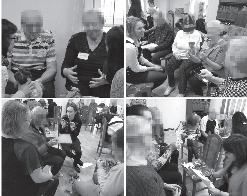
Fotografía 5. Relatos de fantasía