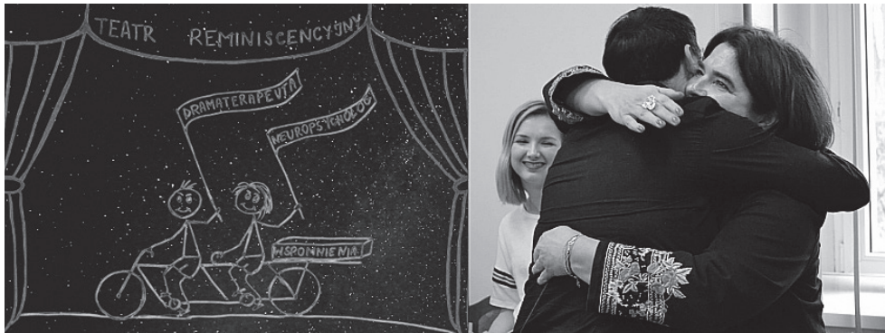
Fotografía 2. Tándem Teatro - Neuropsicología.

vejecimiento activo—. Y ahí entra el teatro de reminiscencia y la dramaterapia con todos sus cachivaches evocativos, inspiradores y reminiscentes.