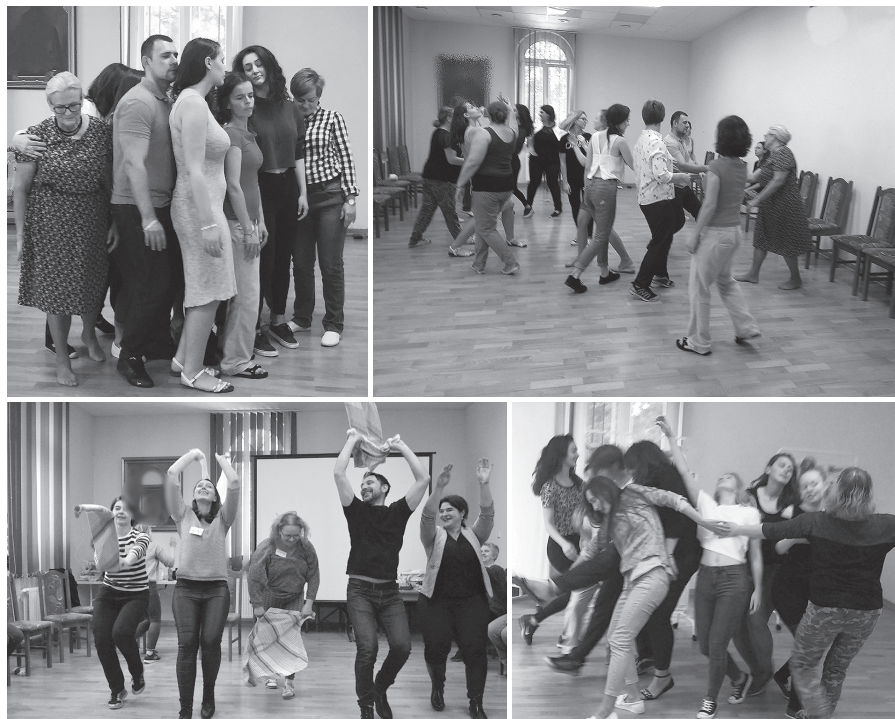
Fotografía 8. Confianza