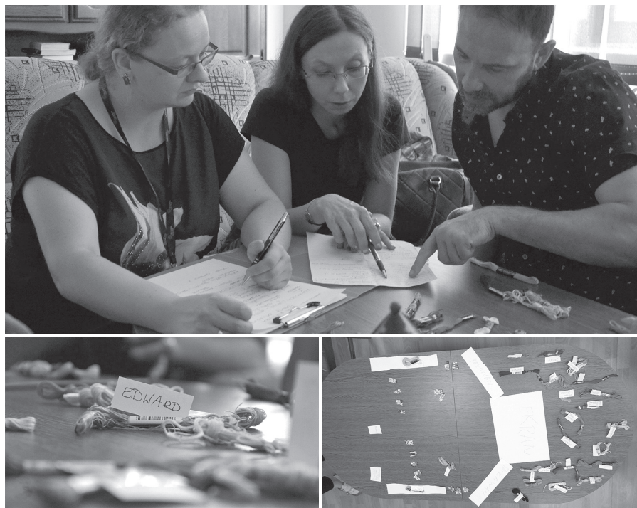
Fotografía 9. Narrativa