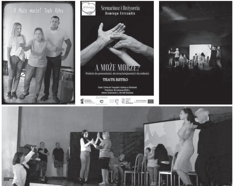
Fotografía 1. Teatro Reminiscencia

La evaluación se realizó de manera presencial. Los evaluadores asistieron a las sesiones de dramaterapia, a los ensayos del teatro de reminiscencia en el centro y en el teatro, también estuvieron presentes al estreno de la pieza escénica. Las actividades han despertado el interés y la admiración de los evaluadores quienes las han calificado con el mayor puntaje.