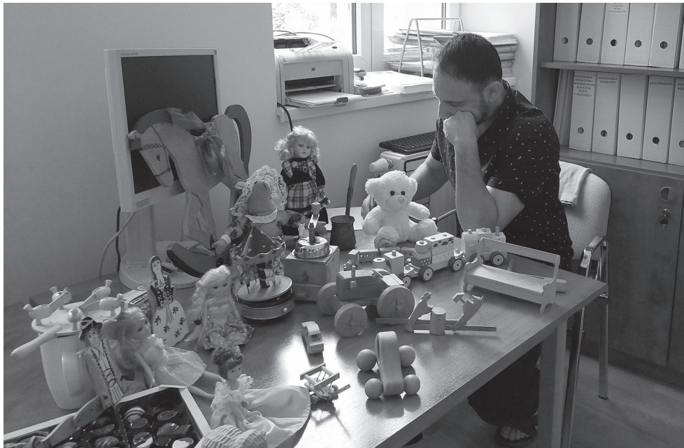
Fotografía 7. Teatro para el recuerdo

Compartir historias de la memoria colectiva: escribirlas en grupo y después dramatizarlas. En las sesiones se narraban momentos históricos y poesía polaca, historias de ficción y biografías interesantes como la de Hedy Lamarr.