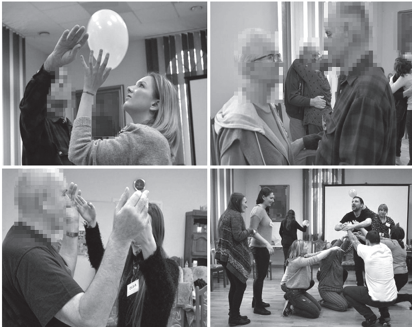
Fotografía 4. Conexión