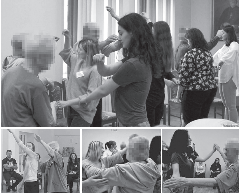
Fotografía 3. Sensorpercepción