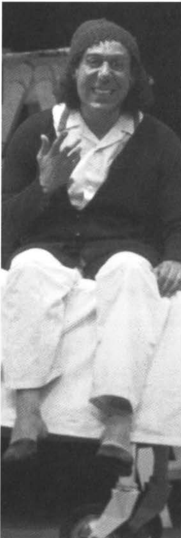
Lindo país esquina con vista al mar. Teatro Ictus, 1979. Nissim Sharim.

Cuando yo era joven pensaba que se podía cambiar el mundo; ahora... estoy seguro.