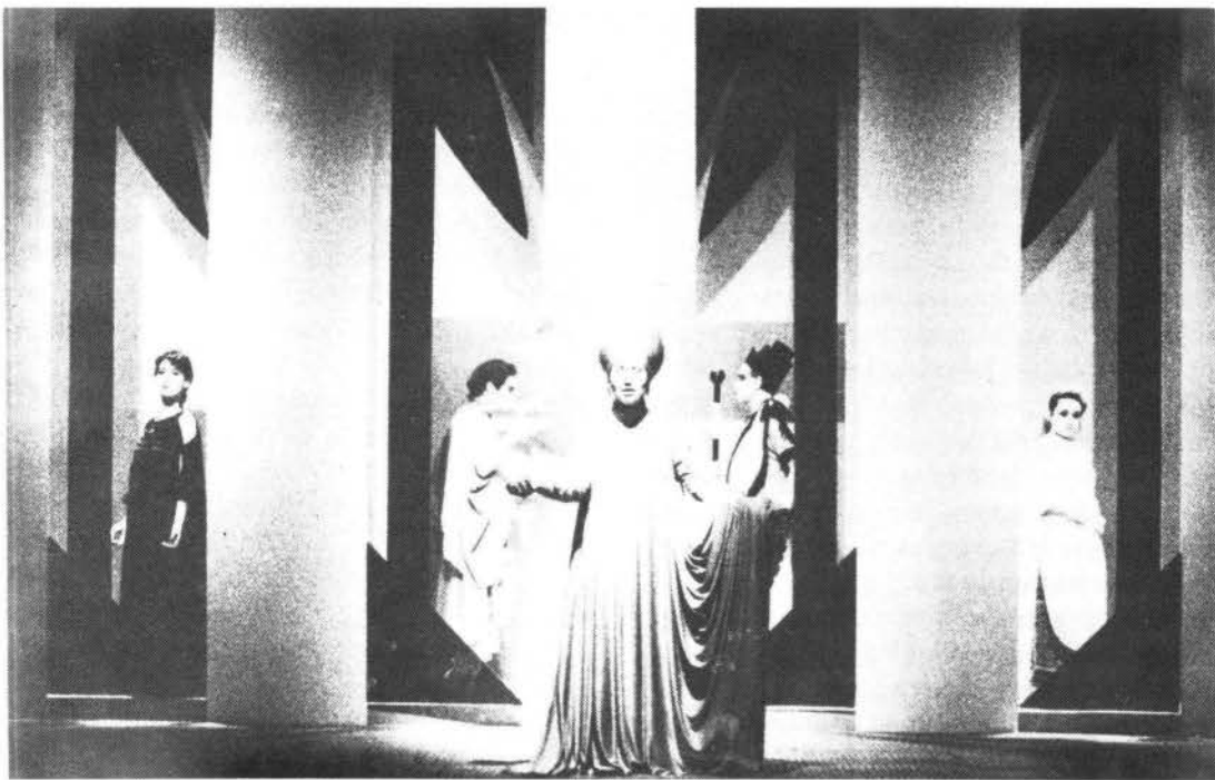
Cuento de invierno.

entre los conceptos de verdad versus mentira: la verdad que existe en la pureza de Hermione se distorsiona a través de los celos y la furia de Leontes, transformándose entonces en la mentira de su supuesta infidelidad con Polixenes (una mentira en la que Leontes insiste en seguir creyendo, contra la convicción que existe en la corte y la autoridad con que hablará el oráculo); Paulina usa la mentira sobre la muerte de Hermione para poder preservar su propia verdad, hasta que Leontes haya demostrado un verdadero arrepentimiento por las terribles acciones que ha cometido. De la misma manera, la verdad sobre la identidad de Perdita se esconde bajo el disfraz de una muchacha campesina y el amor de Florizel por ella permanece maldecido por el padre de éste, hasta el momento en que Perdita nos es revelada como la verdadera hija de Leontes.