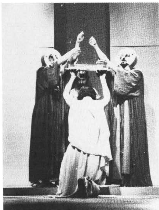
Cuento de invierno.