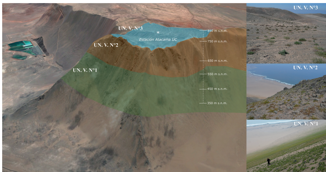
Figura N° 3 Unidades de vegetación del oasis de Alto Patache

En relación a las descripciones anteriores de vegetación para el área, se puede establecer una correspondencia entre la Unidad de vegetación N° 1, Herbazal efímero de Nolana Jaffueli y el piso de vegetación de Matorral desértico tropical costero de Nolana adansonii y N. lycioides , descrito por Luebert & Plissock (2006). Así como también, elementos florísticos descritos para la Unidad de Vegetación N° 2 y N° 3, se encuentran en las descripciones del piso de vegetación de Matorral