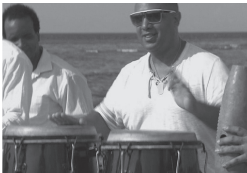
Figura 1. Fotograma del spot Steelband Habana (2016)