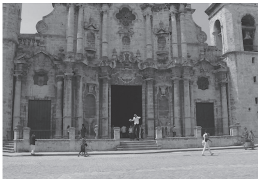
Figura 6. Fotograma del spot Gigante (2016)