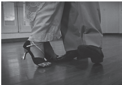
Figura 11. Fotograma del spot Danzón Folclórico (2016)