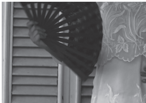
Figura 5. Fotograma del spot Danzón Folclórico (2016)