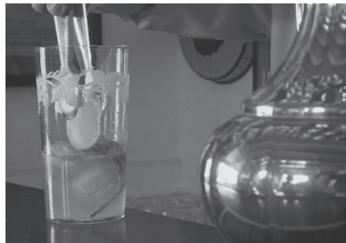
Figura 10. Fotograma del spot Mojito (2016)