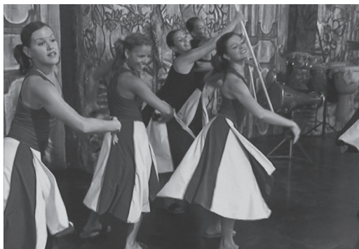
Figura 2. Fotograma del spot Habana Compás Dance (2016)