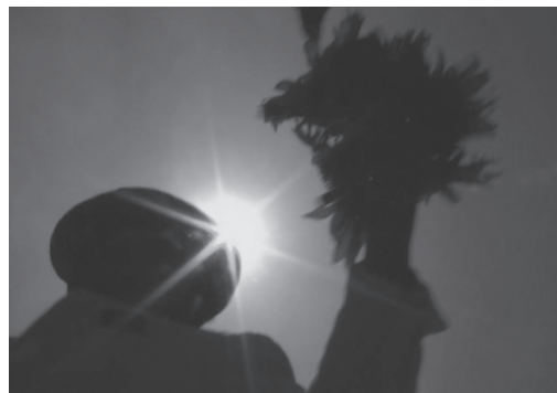
Figura 3. Fotograma del spot Gigante (2016)