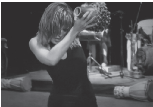
Figura 8. Fotograma del spot Habana Compás Dance (2016)