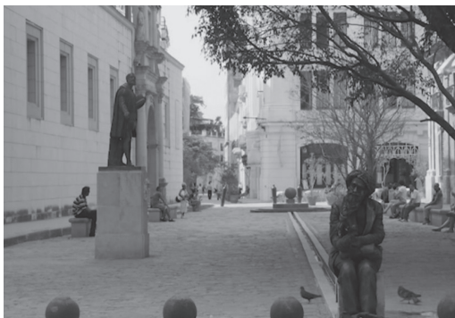
Figura 4. Fotograma del spot Caballero de París (2016)