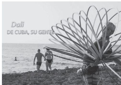
Figura 7. Fotograma del spot Dali (2016)