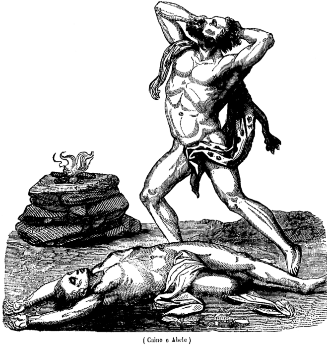
FIGURA 4 Cain y Abel (xilografía)