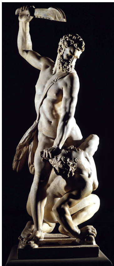
FIGURA 5 Giambologna, Sansón matando a un filisteo (c.1562) (mármol, 210 cm)