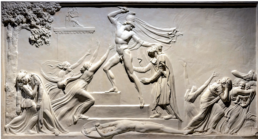
FIGURA 7 Antonio Canova, "La muerte de Príamo" (1787-1792) (yeso, 268 × 140 cm)