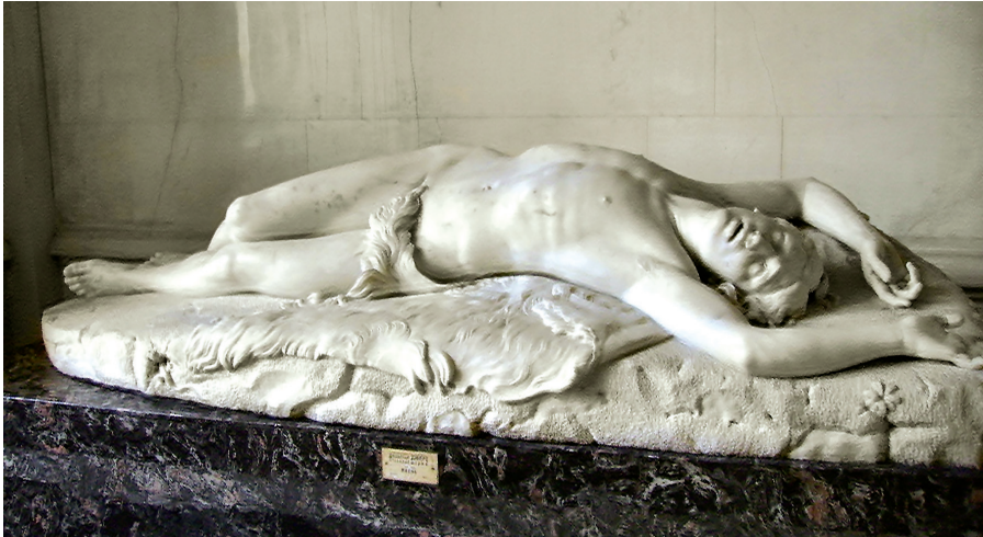
FIGURA 6 Giovanni Duprè, "Abel muriente" (1844) (mármol, 1 235 cm)

carrera, como su más distintiva y personal creación, se reflejan los tenues umbrales que separaban y las oscilaciones que afectaban, en la formación artística académica, a la copia, la imitación y la creación propia.