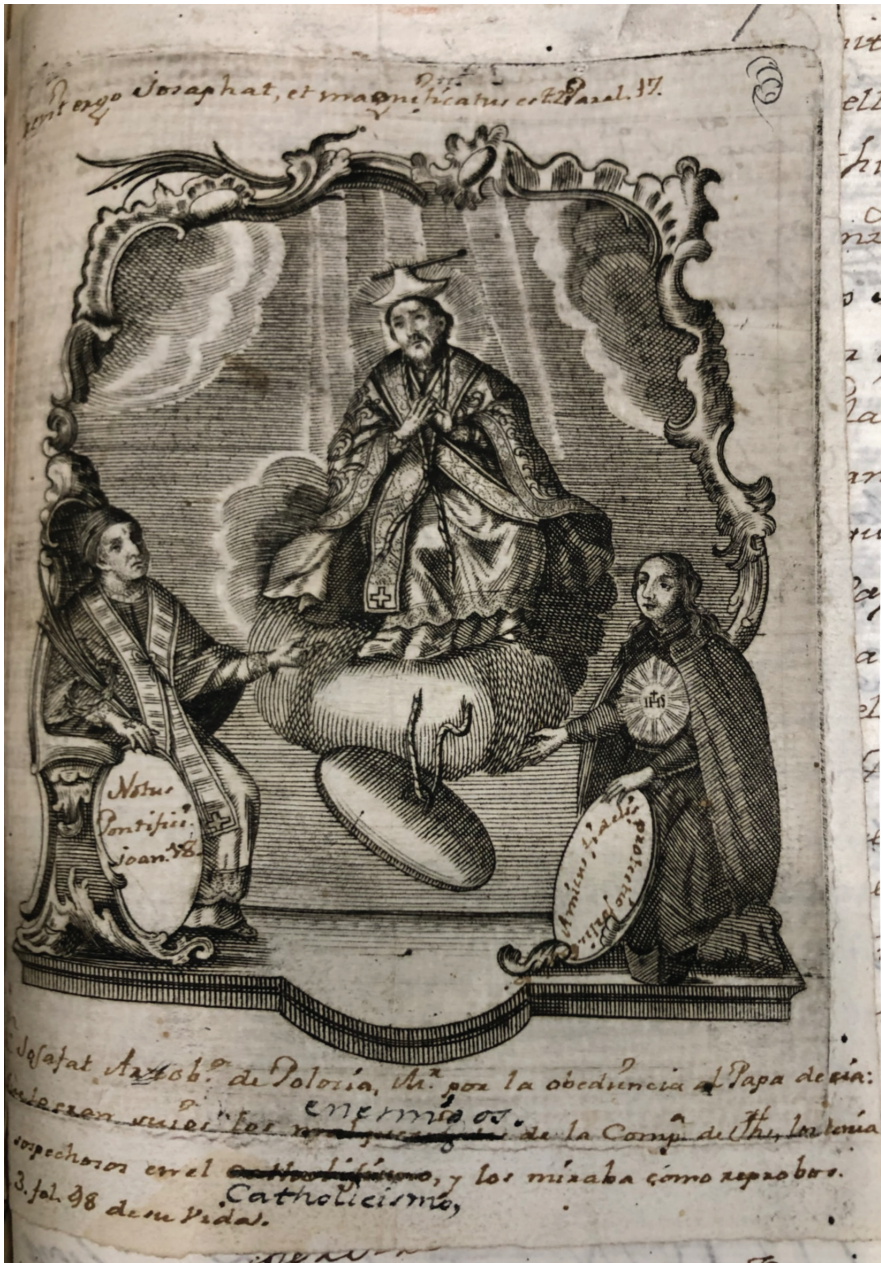
FIGURA 2: ESTAMPA ORIGINAL DE LA VIDA Y MARTIRIO DEL BEATO SAN JOSAPHAT KUNCEVICZ (1684) CON LAS ANOTACIONES DE JOSÉ MANUEL ESTRADA.