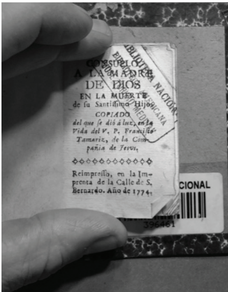
FIGURA 7: EJEMPLAR DE CONSUELO DE LA MADRE DE DIOS (1774), EN TREINTAIDOSAVO.

A partir de la primera edición del Consuelo en el año de la expulsión, ya se puede apreciar esta tendencia a reducir el relato hagiográfico del jesuita ejemplar, hasta solo incluir sus oraciones, consideraciones o métodos de meditación en un libro de bolsillo que el lector o lectora devota pudiese llevar dondequiera que sus negocios seculares lo condujeran. Consuelo también es representativo de las devociones marianas fomentadas por los jesuitas