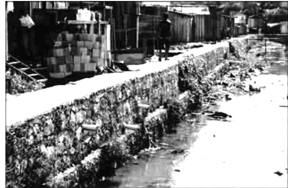
Figura 4. Tuberías de alcantarillado doméstico/sanitario. Igarapé de San Francisco.

Manaus trae en la estructuración de su espacio y de su población, las marcas de esa acelerada y desmesurada urbanización (ver figura 4), perceptible en los barrios que componen la ciudad.