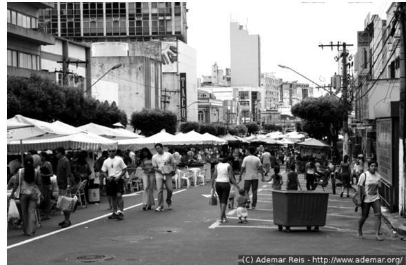
Figura 3. Centro de la ciudad de Manaus

naturaleza y relaciones sociales; región y sitio, en una dimensión exenta de cualquier connotación de tribu, el de grupo lingüístico, nación, lugar y mundo. Implica, eso sí, la comprensión de las relaciones entre Gobierno y sociedad; empresas privadas y sociedad; empresas gubernamentales y de economía mixta y sociedad; empresas públicas y privadas en interlocución con la sociedad, tercer sector y sociedad local.