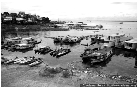
Figura 1. Puerto de Manaus (centro)

Manaus, localizada en la región Norte de Brasil y capital del Amazonas, es el mayor Departamento brasileiro, con un área de 11.401 Km 2 y de clima ecuatorial es considerada el portón de entrada para la mayor reserva ecológica del planeta: La Selva Amazónica. El nombre "Manaus" es originado de la tribu Manaós, que habitaba la región. Su nombre significa "Madre de Dios". La ciudad comenzó a ser colonizada en 1669, como un pequeño fuerte en piedra y barro con cuatro cañones, llamado Fuerte de San José de la Barra del Río Negro. En torno de este fuerte, nació el pueblo que dio origen a la ciudad de Manaus (ver Figura 1). En 1833 pasa a la categoría de Villa, con el nombre de Manaus. El 24 de Octubre de 1848 recibe el título de ciudad, tornándose la capital de la provincia del Amazonas.